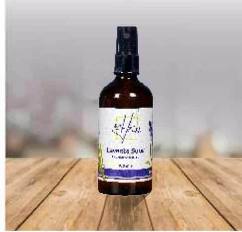
Lavanta Suyu 100 ml

Huzur verici ürünlerimiz, %100 doğal olup handmade yani el yapımı ürünlerdir. Bu ürünler müşteri siparişine göre tarafımızdan kolilenip gönderilmektedir. Asgari sipariş adedi 50'dir.