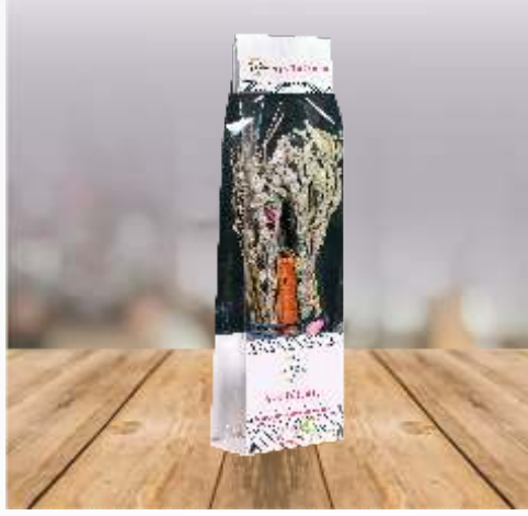
%100 Doğal Aşk Tütsüsü