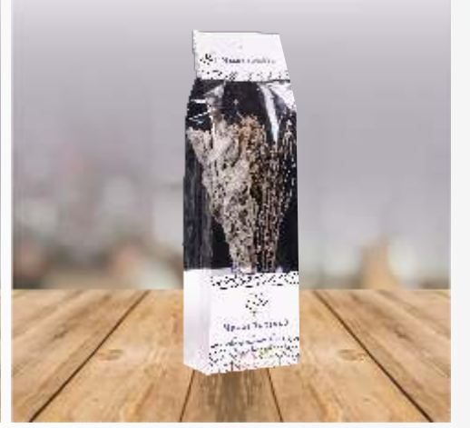
%100 Doğal Nazar Tütsüsü