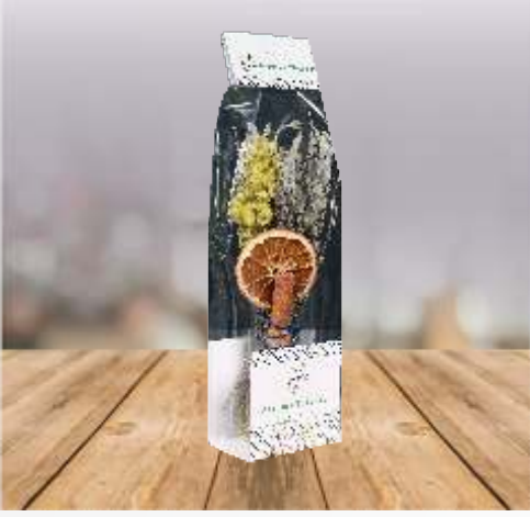
%100 Doğal Arınma Tütsüsü