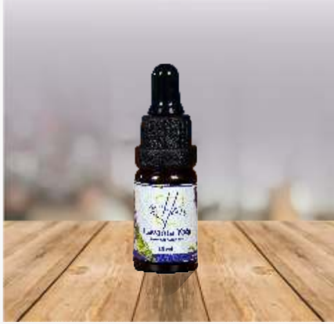
Lavanta Yağı 10 ml